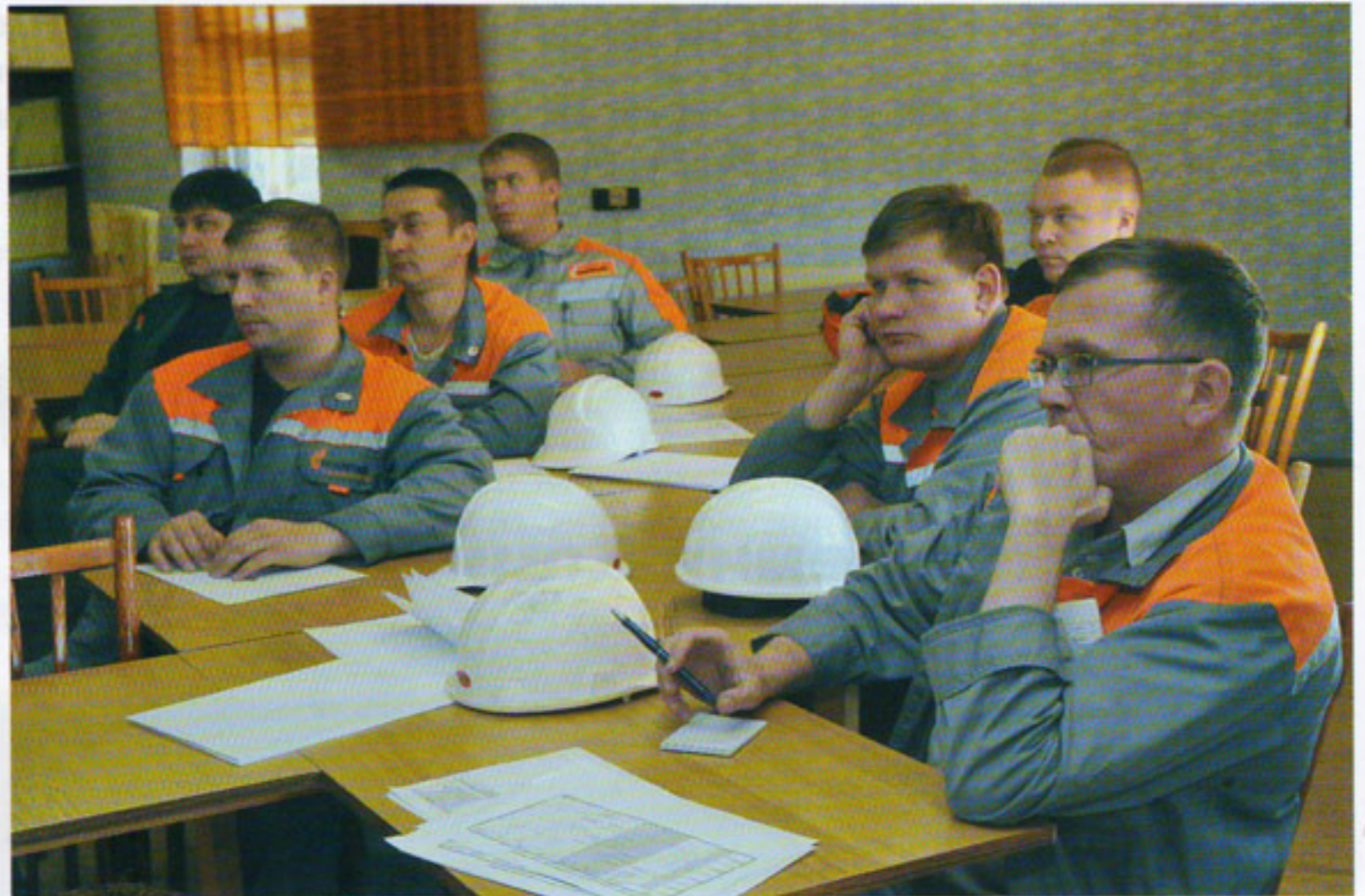
Обучение в рамках проекта «СТЕП» в Учебном центре

С одной стороны, ОАО «Монди СЛПК» заинтересовано и активно участвует в подготовке высококвалифицированного кадрового потенциала для лесных отраслей — всесторонне развитых молодых специалистов, владеющих передовыми знаниями и технологиями, обладающих высокой мотивацией к профессиональному росту и саморазвитию. С другой стороны, руководство компании принимает на себя высокую социальную ответственность за собственных работников, разрабатывает и внедряет поддерживающие меры, которые обеспечивают устойчивое развитие бизнеса и общества. Комплексом таких мер и является Лесная академия Коми.