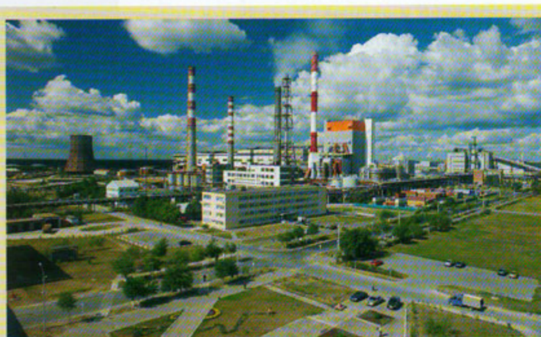
ОАО «Монди Сыктывкарский ЛПК» — лесопромышленный гигант на Вычегде