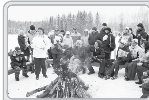
На лыжне России