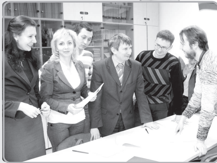
В споре рождается истина