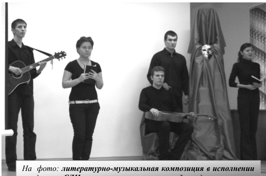
На фото: литературно-музыкальная композиция в исполнении студентов СЛИ - участников театральной студии