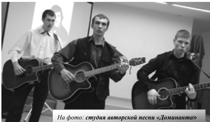
На фото: студия авторской песни «Доминанта»