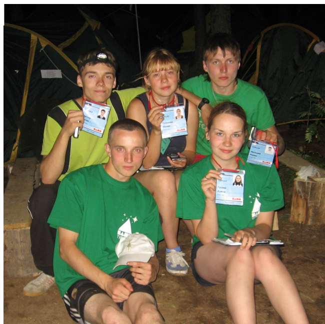
На Селигере наши ребята получили дипломы об окончании «Школы инструкторов детско-юношеского туризма».

Несмотря на то, что все делегации, представляющие одно направление, создали некий маленький городок со своими законами, собственной прессой, телевидением. Также во время работы форума на территории лагеря действовали общая система денежных поощрений (все они выдавались в «талантах»; один талант был равен одному рублю) и штрафов (за каждое нарушение правил, принятых на форуме, ставился прокол в личном бейджике провинившегося; после трех проколов участника просили покинуть мероприятие).