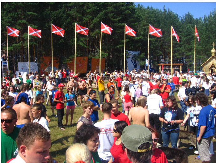
Вот так выглядело место общего сбора всех делегаций, съехавшихся на форум.