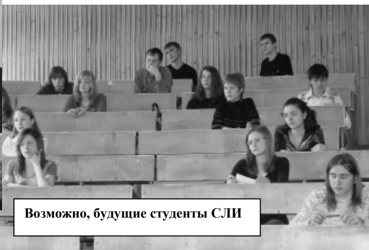
Возможно, будущие студенты СЛИ