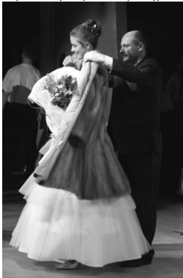
Беседовала Светлана Дубинина, пресс-служба СЛИ.

В психологическом плане это дает то, что начинаешь чувствовать себя намного увереннее, свободнее в общении, учишься выстраивать отношения с теми, кто, по сути, является твоим соперником. Сначала, к примеру, дух соперничества был очень силен и отношения между участницами были достаточно натянутыми. К концу конкурса все изменилось.