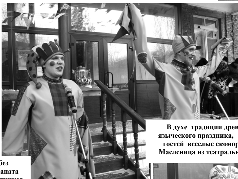
В духе традиции древнего русского языческого праздника, приветствовали гостей веселые скоморохи и боярыня Масленица из театральной студии СЛИ.

Какое же празднование Масленицы без народных забав и игр! Перетягивание каната, метание валенка, бой подушками – участников и зрителей-болельщиков было не просто остановить, настолько захватили всех эти немудреные, но очень веселые развлечения!